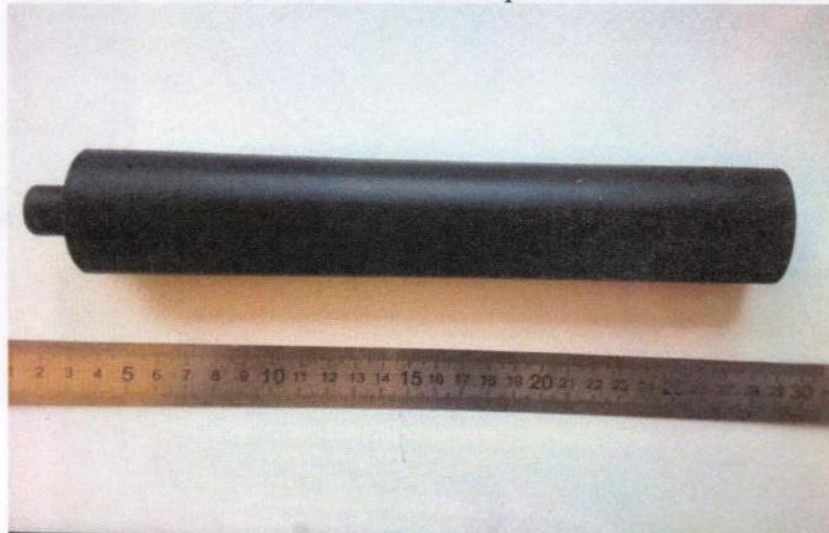
Иллюстрация № 1. Представленный на исследование объект. (вид сбоку)

Иллюстрационная таблица к заключению эксперта № 22 от «03» сентября 2018 г.