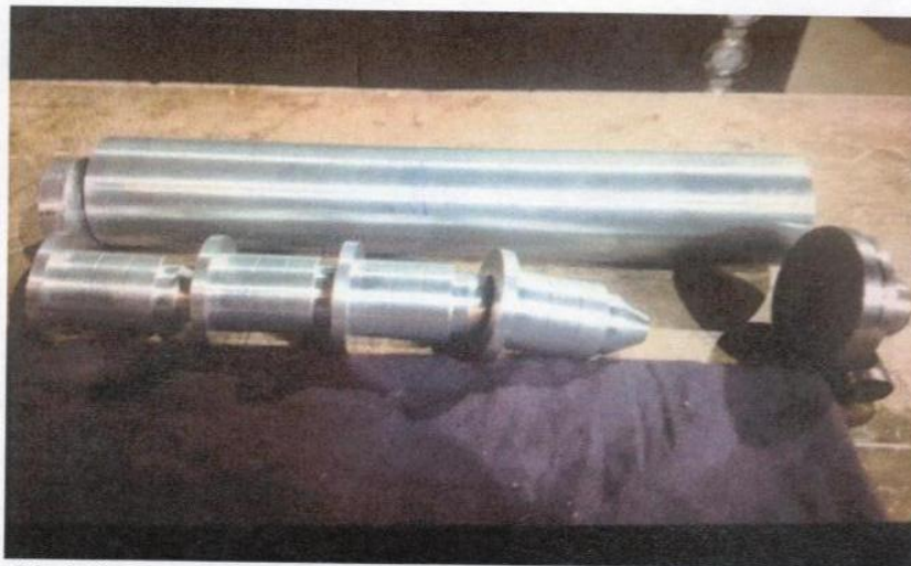
Иллюстрация № 4. Составные части исследуемого объекта. (Объект в разобранном состоянии, до окраски и до окончательной сборки в готовое изделие)